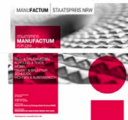
Flyer zum Wettbewerbsaufruf.

Folgen Sie uns auf Facebook und Instagram .